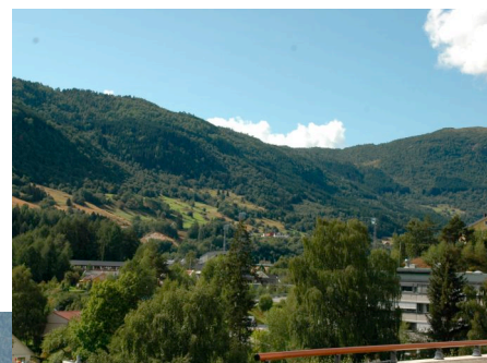
Utsyn fra balkong